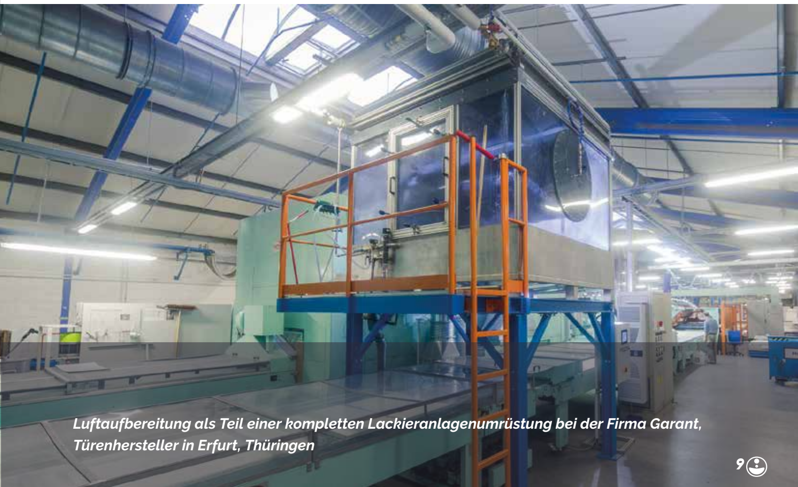
Luftaufbereitung als Teil einer kompletten Lackieranlagenumrüstung bei der Firma Garant, Türenhersteller in Erfurt, Thüringen